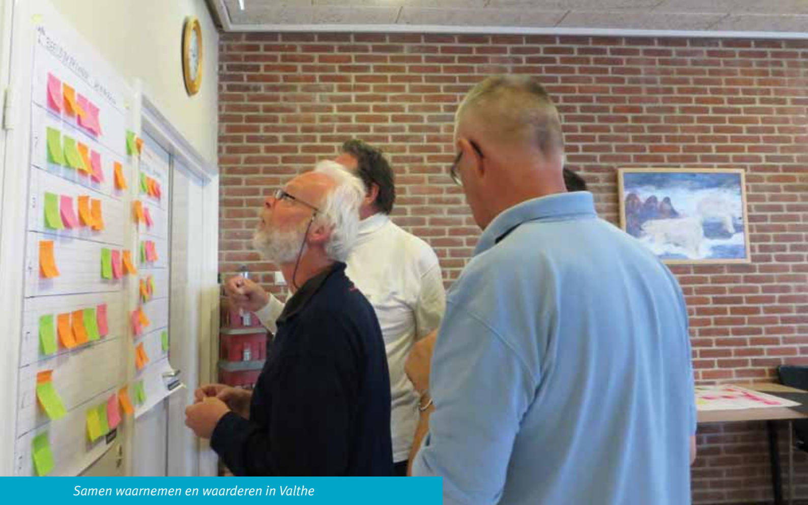
Samen waarnemen en waarderen in Valthe