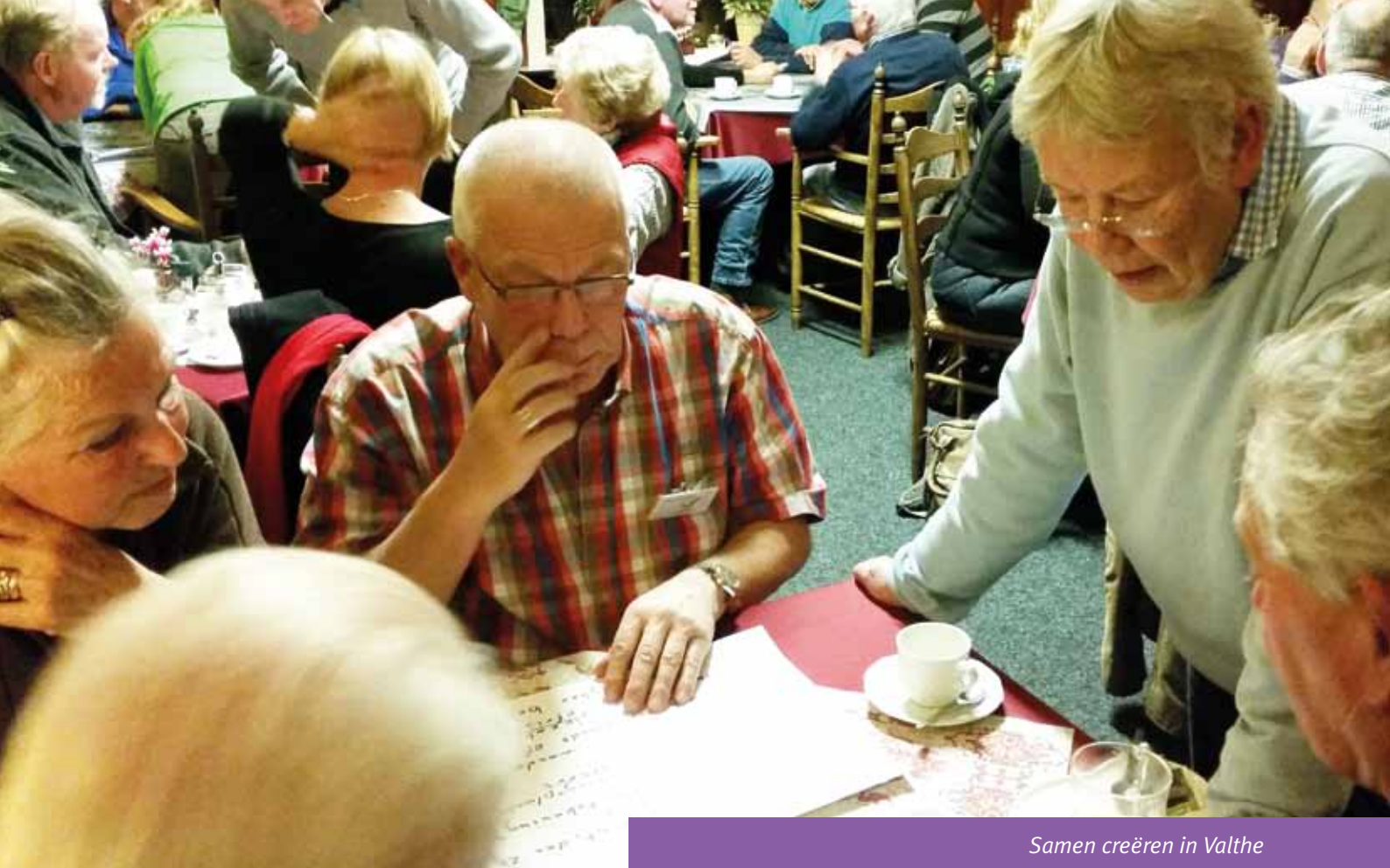
Samen creëren in Valthe