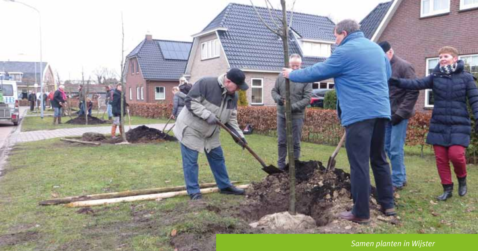
Samen planten in Wijster